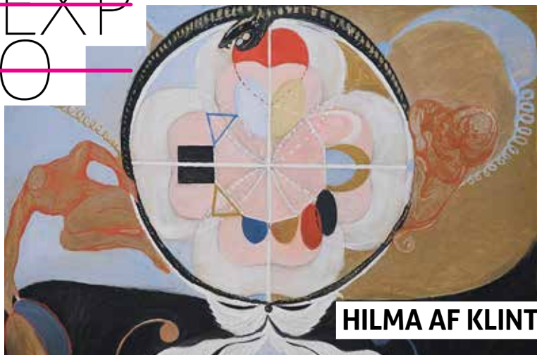
HILMA AF KLINT

Hasta el 2 de febrero. Guggenheim Museoa. BILBAO /// Bizkaia. 18€